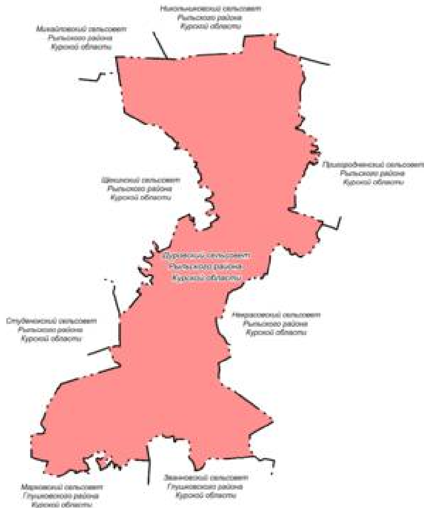
Рис. 1.1.1 Существующие границы муниципального образования «Дуровский сельсовет» Рыльского района Курской области

Численность населения на 01.01.2023 года составила 377 человека.